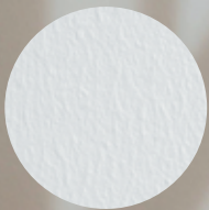
空間に馴染む普遍的な漆喰色

リフォームでは既存クロスの上から施工可能で廃棄物を削減。洋室・和室を問わず、住宅、店舗、施設などあらゆる空間にマッチする、安全性の高い塗壁材です。