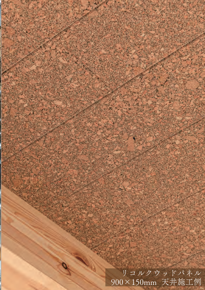
リコルクウッドパネル 900×150mm 天井施工例