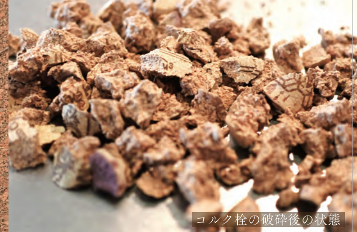
コルク栓の破碎後の状態