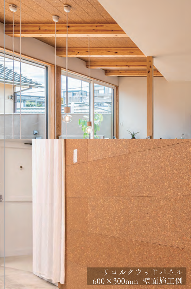
リコルクウッドパネル 600×300mm 壁面施工例